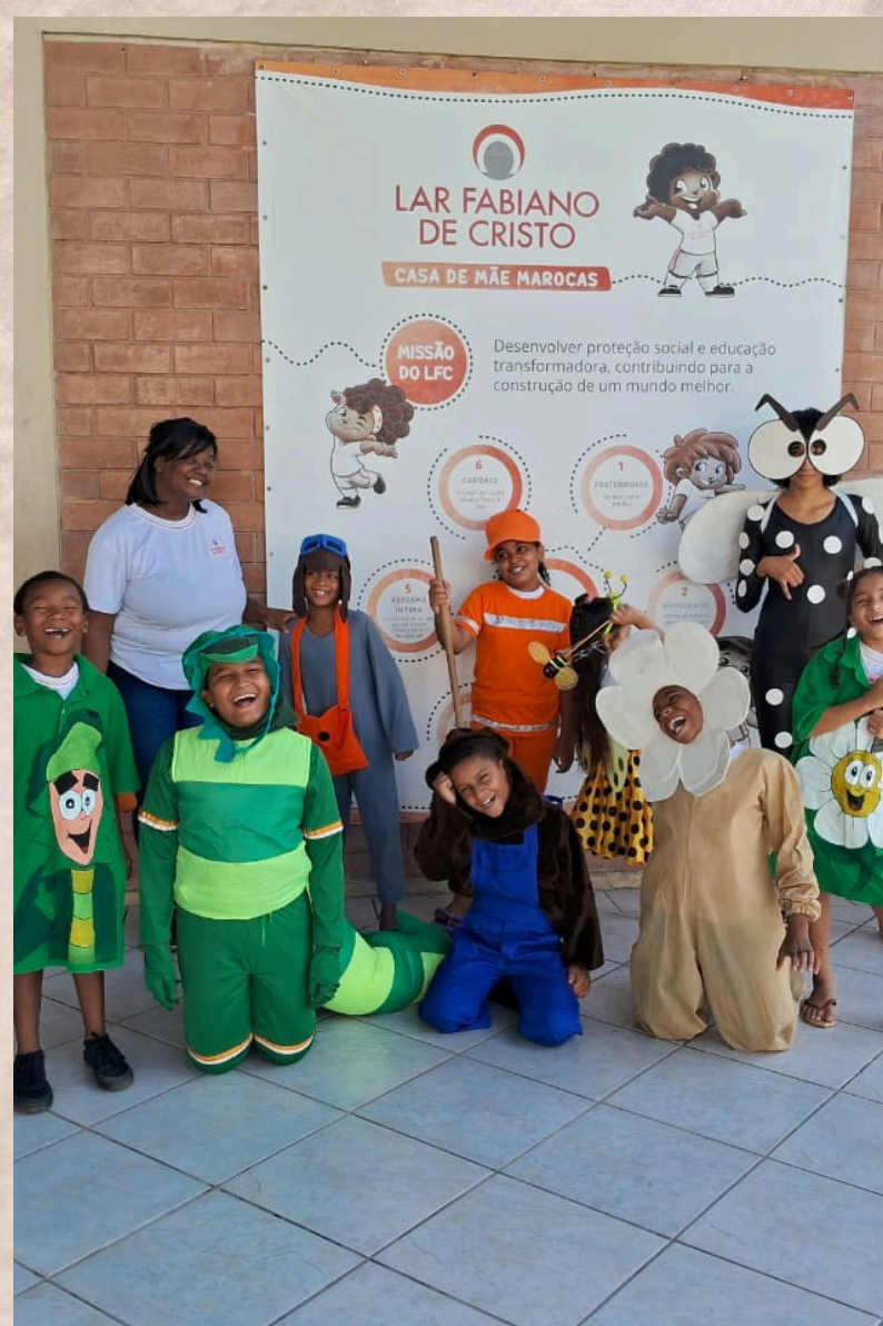
CAMPANHA XÔ DENGUE